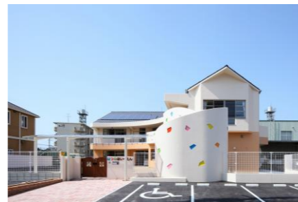
はつねほいくえん(社福)