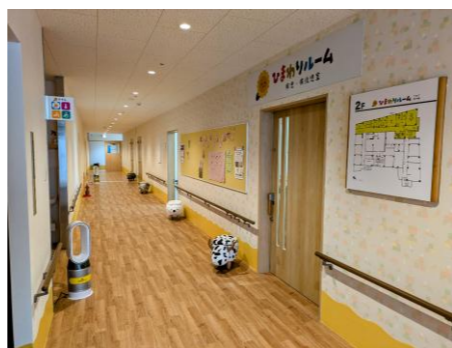
笑顔で挨拶お迎え(受入室)