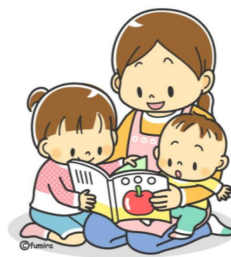
体調に合わせて過ごします