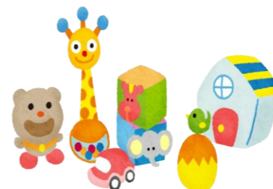
発達や興味に合った玩具