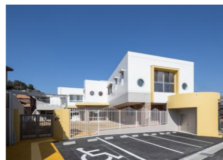
てんらいじほいくえん(社福)