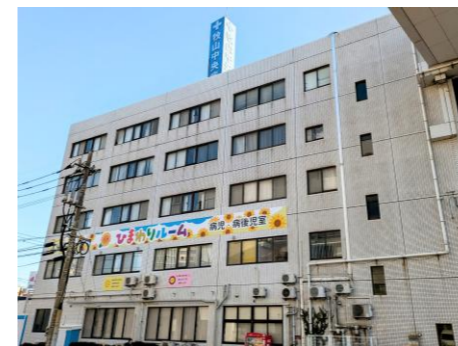
牧山療養院(旧牧山中央病院) 内科・小児科・療養介護事業所