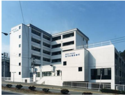
金刀比羅診療所 ケアハウス金刀比羅(社福)