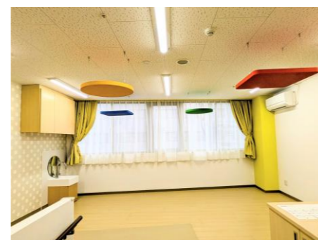
医師の診察・病状に合わせてお部屋が決まります(安静室)