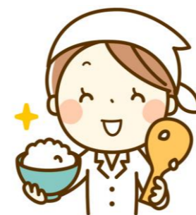
管理栄養士による食事提供