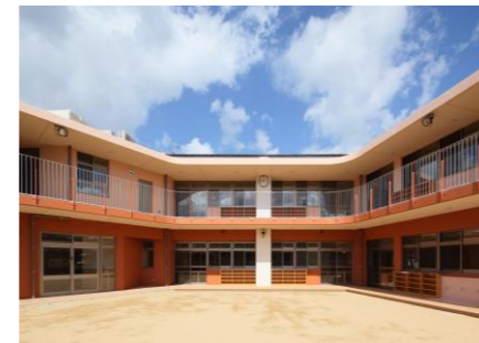
さんろくこどもえん(社福)